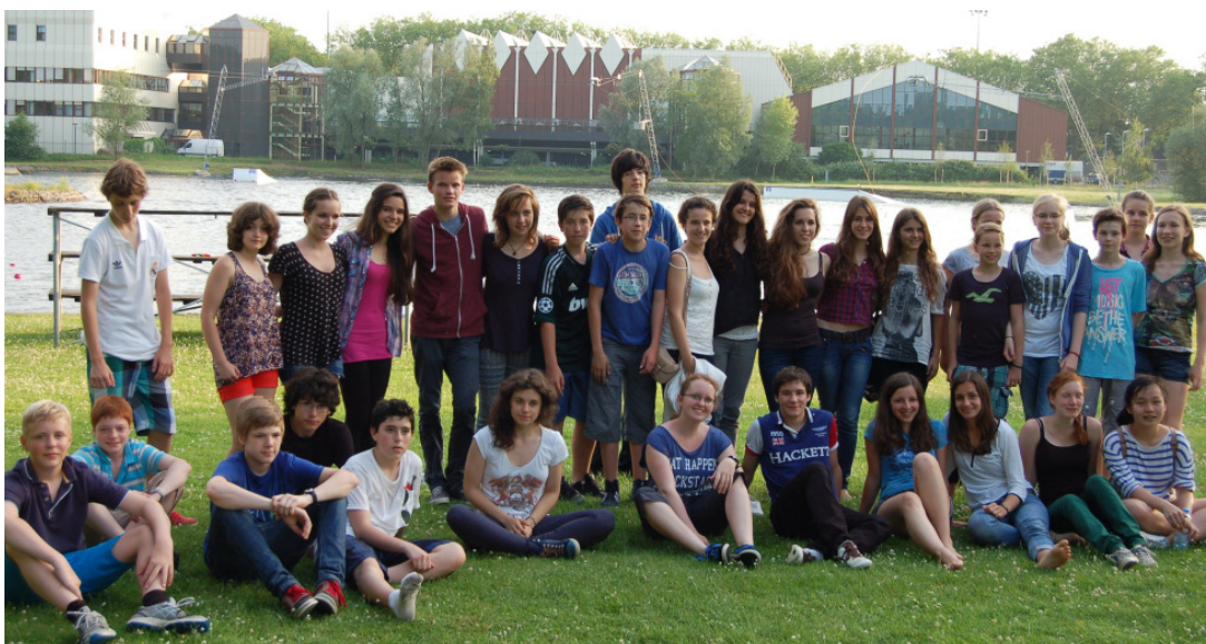
Alle freuen sich auf den Gegenbesuch im Oktober 2013